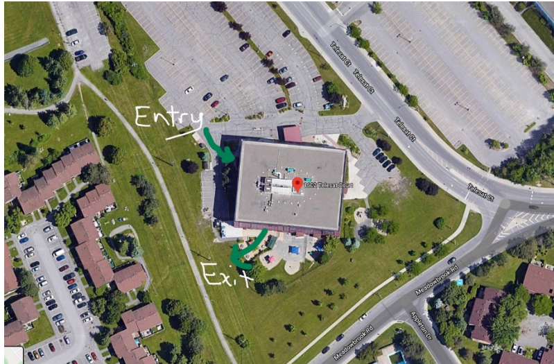
Diagramme du flux de circulation au Centre de l'Est